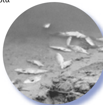
Above: Water Pollution