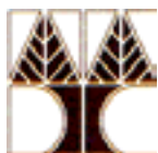
University of Cyprus