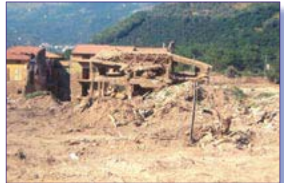
Above: The remains of a house after a landslide in Quindici, Italy.

πως εξετάζονται τα θέματα διαχείρισης περιβαλλοντικών κινδύνων και τα συναφή ζητήματα στο επίσημο σχολικό πρόγραμμα.