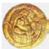
University of Crete